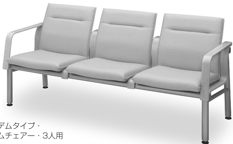
タンデムタイプ・ アームチェアー・3人用