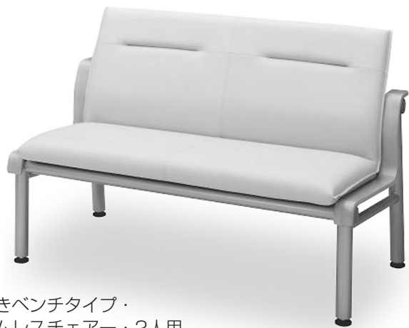
背付きベンチタイプ・ アームレスチェアー・2人用