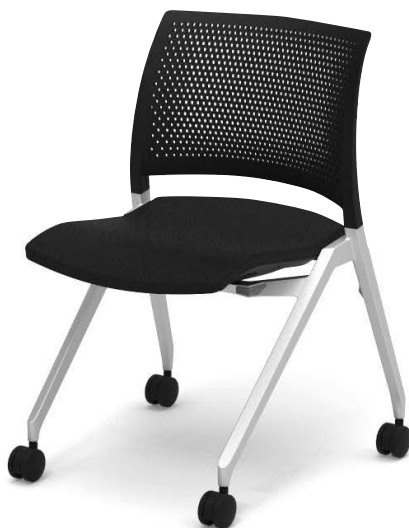
キャスタータイプ K11-S210