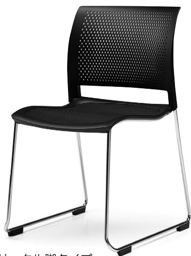
サークル脚タイプ K11-M34